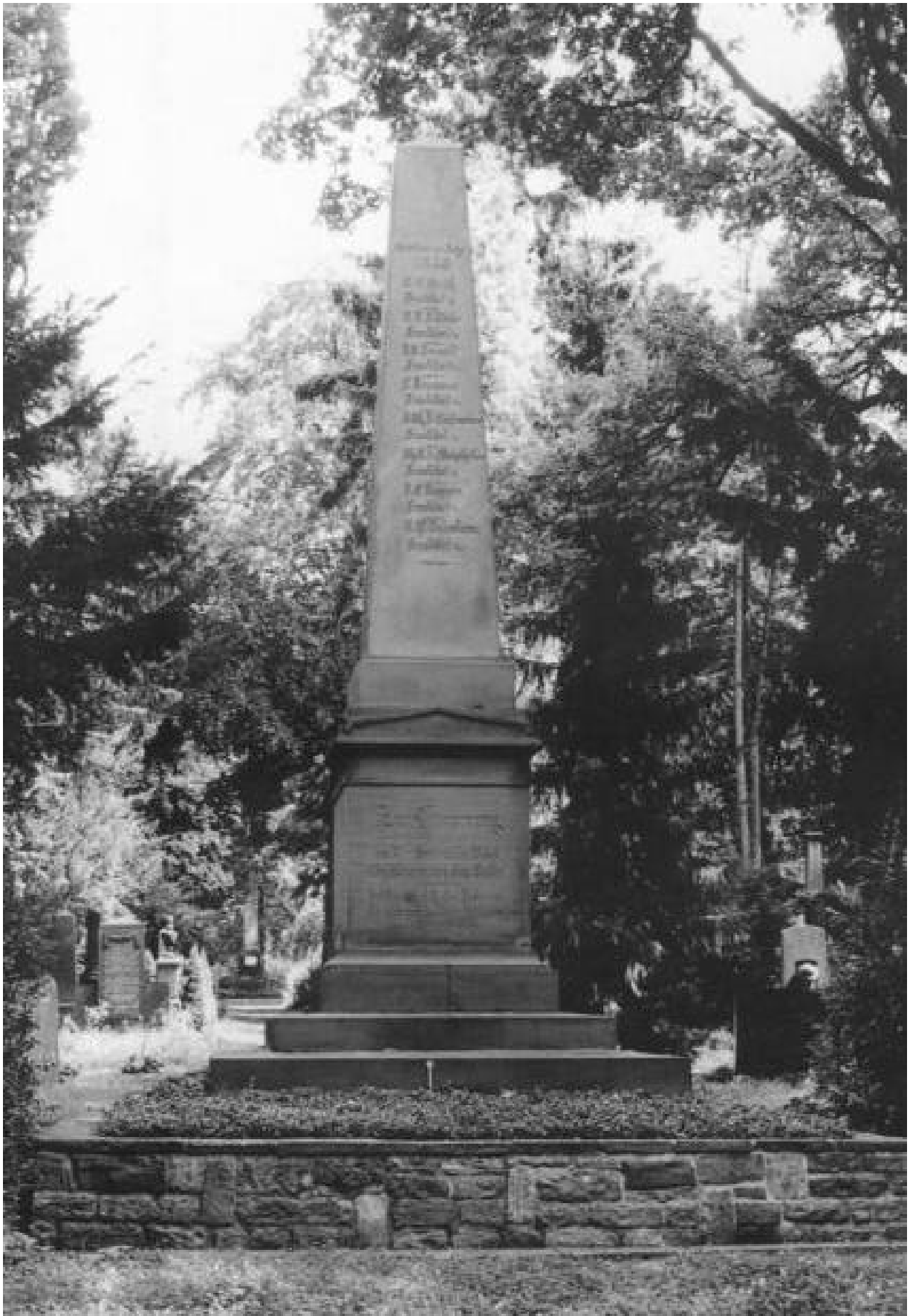
Denkmal Zur Erinnerung für die am 18. September 1848 Gefallenen aus dem Volke, Gewann E 17-21 , auf dem Hauptfriedhof.