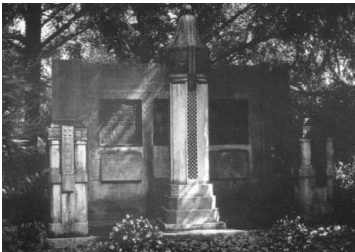
Oben: Grabstätte Strömsdörfer, Gewinn II 117/18 An der Mauer, auf dem Hauptfriedhof.