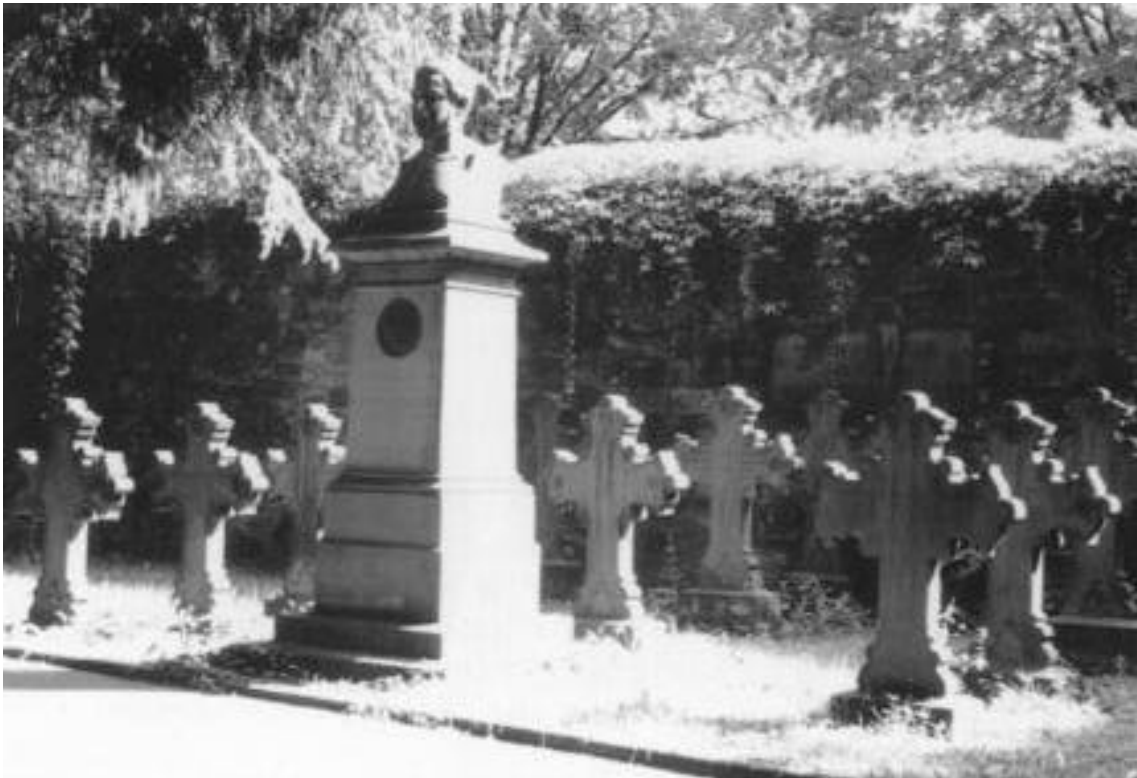
Oben: Grabstätte Guaita, Gewinn C 8-9, auf dem Hauptfriedhof.