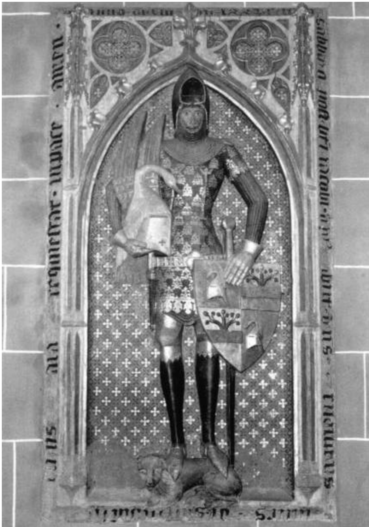
Oben: Epitaph des Rudolf von Sachsenhausen im Dom, um 1375.