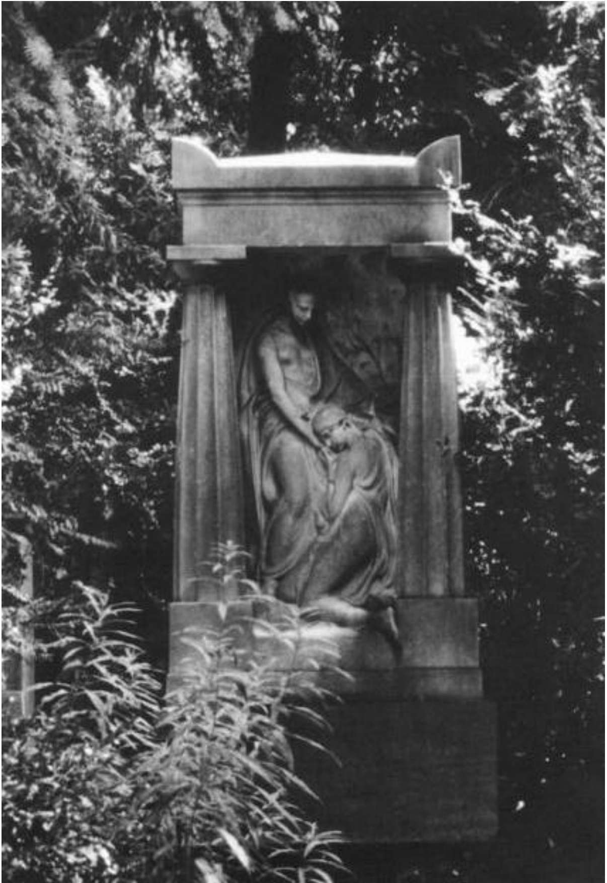
Grabstätte Schacht, Gewinn I 257, auf dem Hauptfriedhof.