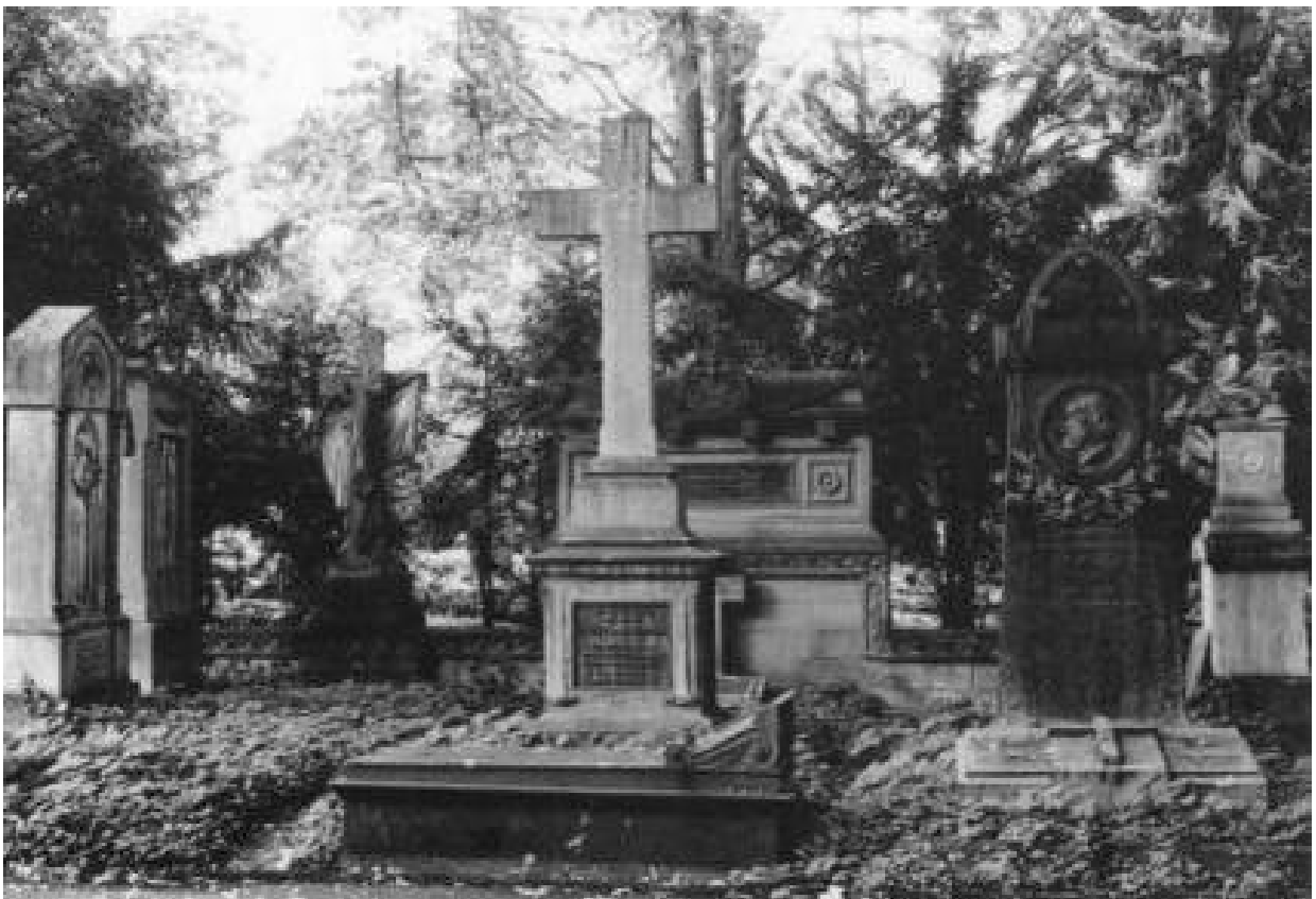
Oben: Grabstätte Rau, Gewinn D 288, auf dem Hauptfriedhof.