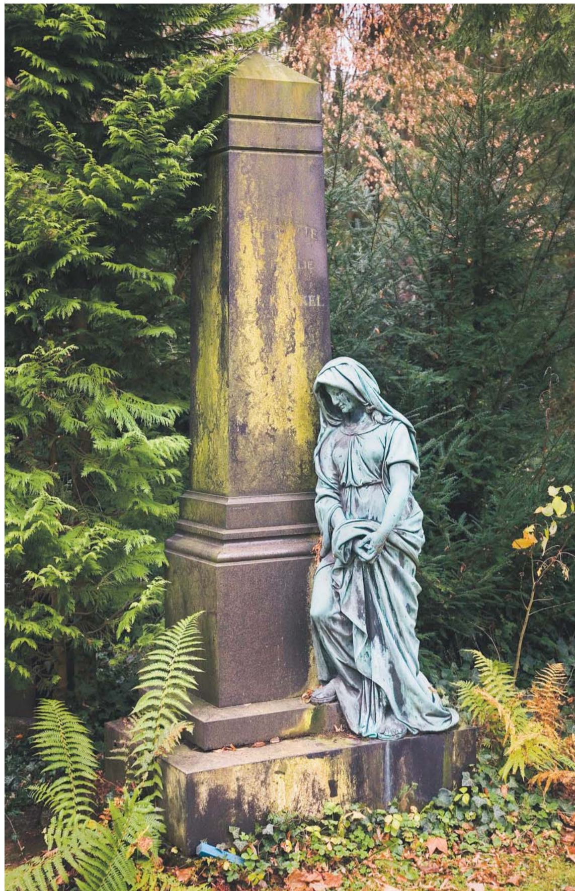
Auch dieser Obelisk mit der trauernden Frauenfigur zählt zu den Grabmalern, die gepflegt werden wollen.

Manch einer ist, nachdem er erst einmal mit Wurzelbürste und Schleif-Vlies