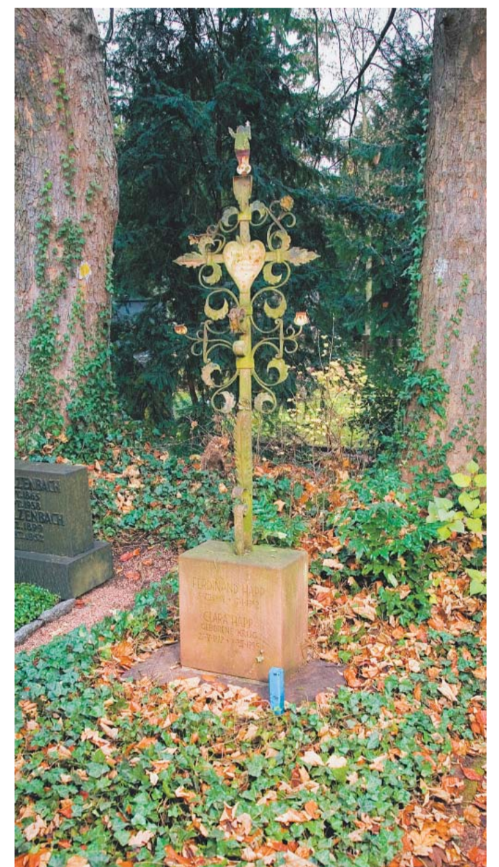
Auch dieses Grab könnte einen Liebhaber finden.